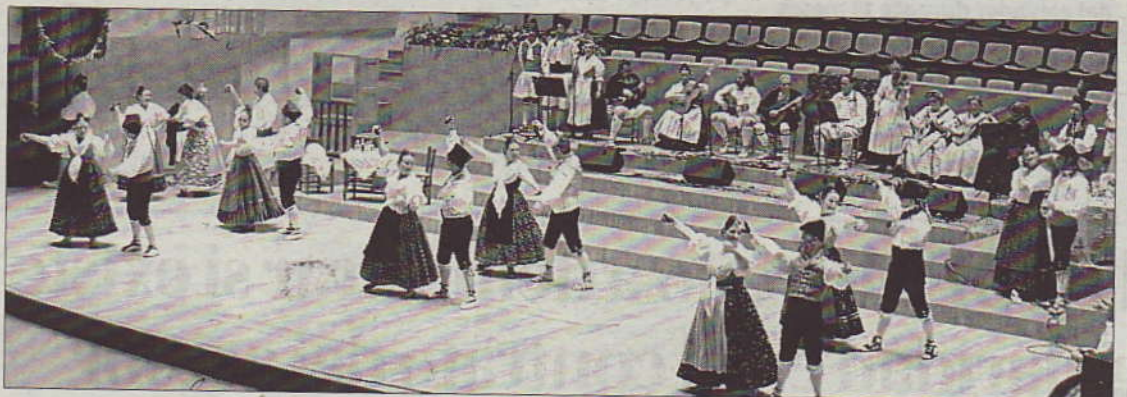
Instante de la actuación del grupo Les Folies en el Palau de la Música de Valencia.

El grupo de baile Les Folies de Carcaixent consiguió reunir a un numeroso público en su actuación en el Palau de la Música de Valencia. El espectáculo tradicional mostraba tres de las escenas festivas locales. L-EMV ALZIRA